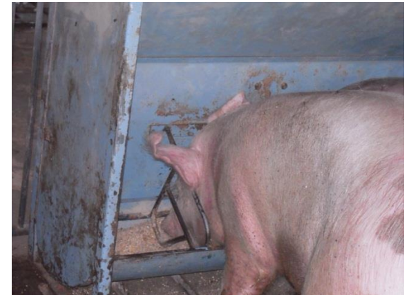
発酵もみ殻5%を混ぜた餌 食事中