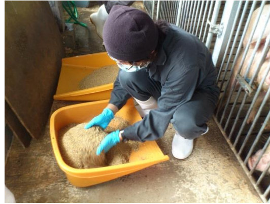
通常餌に発酵もみ殻5%を混ぜているところ