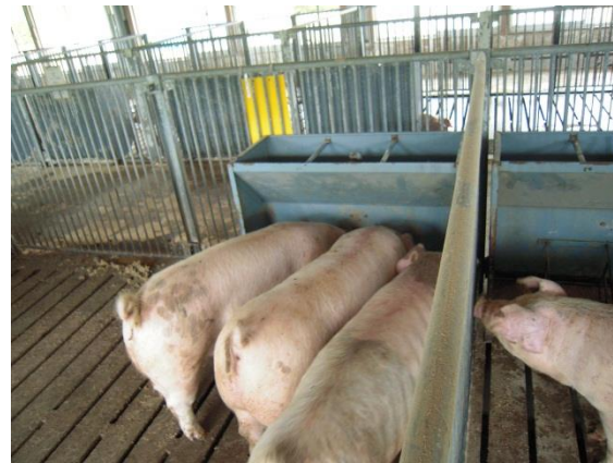
発酵もみ殻5%を混ぜた餌 食事中(隣の豚、興味津々)