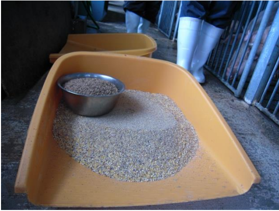
通常餌5kgに対して発酵もみ殻5% (ボール)を与える