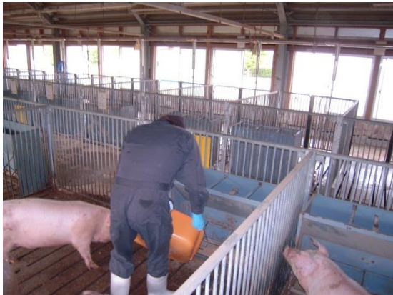
左発酵もみ殻5%を混ぜた餌を餌箱へ 3頭の檻で実験