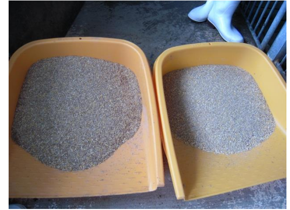
左発酵もみ殻5%を混ぜた餌、右通常餌